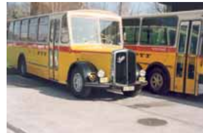
Im Vordergrund sehen wir den L4C CT2D, der im Jahr 1982 dem Saurer RH 525/23 (Hintergrund) weichen wird. 5

Ein neuer Kurswagen zu 26 Plätzen, ein Saurer L4C CT2D, wird neu angeschafft und eingesetzt. 4