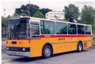
Der neue Saurer RH 525/23. b

Sitzplätze anbieten. 4 Mit dem neuen Fahrzeug hält die Funktechnik auf der Linie Einzug. Noch heute wird diese Technik zwischen den Fahrzeugen verwendet. 3