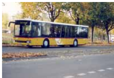
Der neue Setra S 315 NF. b

Der 1984 eingeführte Saurer RH 525/23 hat mit einem Kilometerstand von 1'300'000 ausgedient. Othmar Sidler erhält ein neues Fahrzeug. Ein Setra S 315 NF wird eingeweiht. Dabei handelt es sich das erste Mal um ein Niederflerfahrzeug, das der „Euro 2-Norm“ entspricht. 3