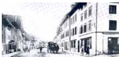
Stadtstrasse in Sempach um 1910. Mitten auf der Strasse befindet sich die Postkutsche. 9

Eich wird in das Postwagenkursnetz eingebunden. Täglich fahren sieben Kurse zwischen Sempach Station und Sempach Stadt, davon führen zwei Kurse weiter nach Eich. 1